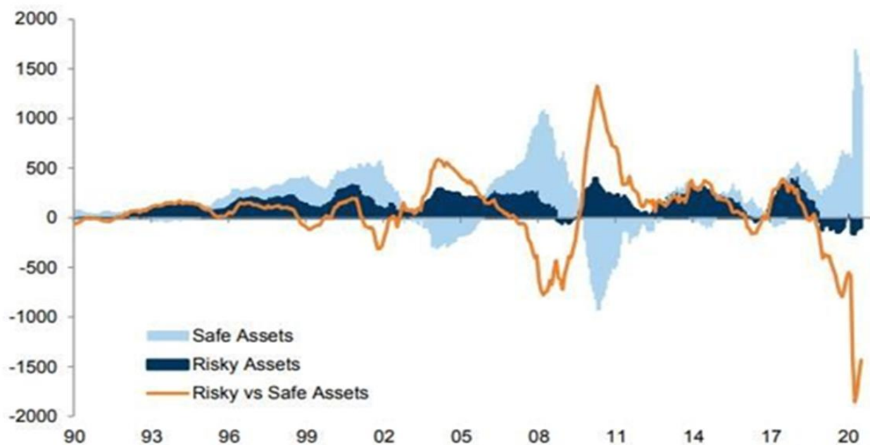
Figuur 1 Kapitaalstromen in Amerikaanse fondsen: risicovolle fondsen (aandelen) versus defensieve fondsen (obligaties, geldmarkten,...)